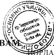
ИОРДАНКА СТАНЧЕВА ДИРЕКТОР